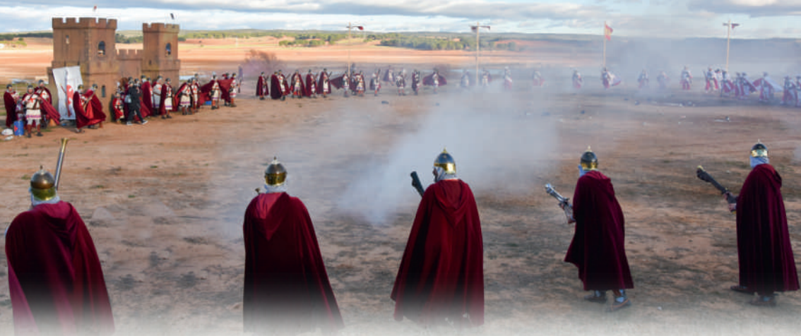
“LAS GUERRILLAS”: BATALLA ENTRE MOROS Y CRISTIANOS.